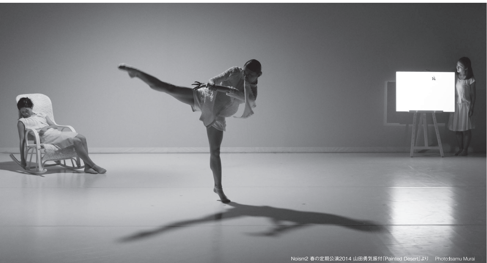
Noism2 春の定期公演2014 山田勇気振付「Painted Desert」より

Seeking male & female members for the junior company of Noism1