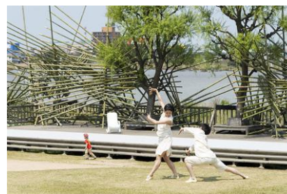
Noism2 特別公演 in 新潟 ODORI@潟 『Painted Ghost』(2014年)

2013年9月より開始した10thシーズンからNoism2 専属振付家兼リハーサル監督に山田勇氣が就任、現在20~25歳のプロを目指す研修生8名が在籍しています。今シーズンは山田勇氣のもと、新潟市内各地で開催されたイベントや公演に出演し、さまざまな場所で踊ることで経験を積んだNoism2のメンバーたち。今シーズン締めくくりとなる本公演では、どのように成長した姿を観せてくれるのか、ご期待ください。