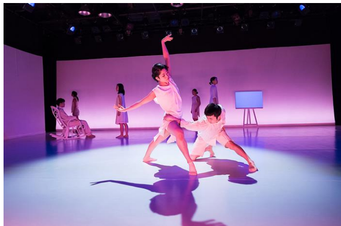
Noism2 春の定期公演 2014 より『Painted Desert』(演出振付: 山田勇気)