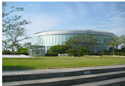
白山公園 空中庭園 3 (信濃川に向かって流れる水のスロープとやすらぎ場に続く大階段のある庭園)

劇場を飛び出し、さまざまな場所でサイトスペシフィックな作品を発表してきた「Noism2 夏の特別公演」も今回で3回目。新作『RAFT』は、白山公園の「空中庭園」を会場に野外公演として開催します。信濃川の雄大な流れと、刻々と過ぎる時間を背景に、山田勇氣の新作を上演します。室内の劇場では体験することのできない、作品と空間との一期一会の瞬間を体感いただけます。